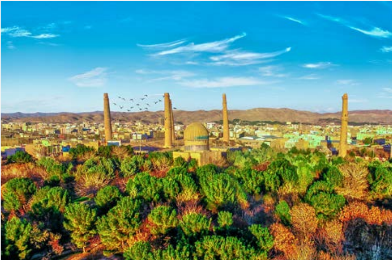
Vista di HERAT , città natale di Sonita Alizadeh